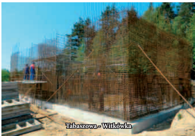
Tabaszowa - Witkówka

Woda ze zbiorników zaopatrywać będzie mieszkańców z miejscowości: Tabaszowa, Rąbkowa, Znamierowice, Tęgorozę, Świdnik, Białawoda, Zawadka, Rojówka, Łyczanka, Skrzętla, Wronowice, Bilsko oraz Łososina Dolna.