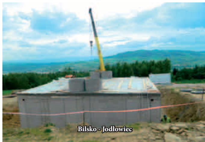
Bilsko - Jodłowiec