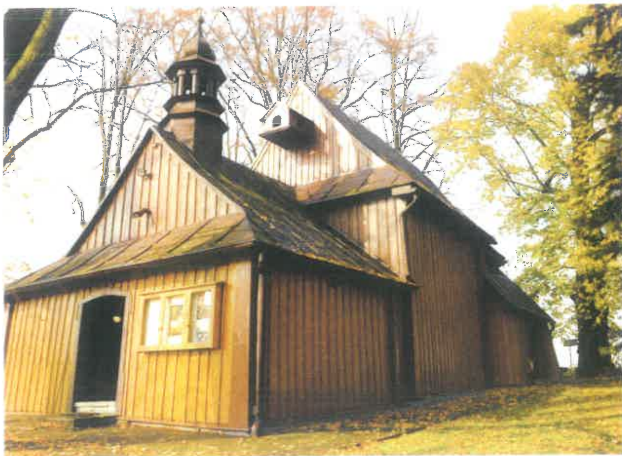
Fot.2 Tęgoborze. Kościół p.w. Narodzenia NMP na górze św. Justa – widok od strony południowo-zachodniej