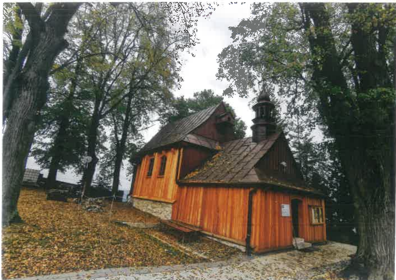
Fot. 1 Tęgoborze. Kościół p.w. Narodzenia NMP na górze św. Justa – widok od strony północno-zachodniej