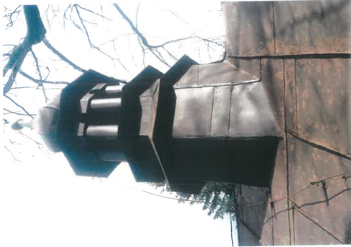
Fot. 5 Tęgoborze. Kościół p.w. Narodzenia NMP na górze św. Justa – wieża kościoła