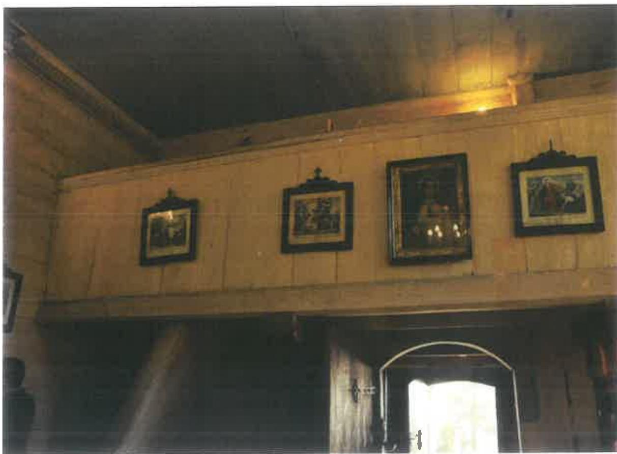
7. Kościół w Tęgoborzu-Juście – widok w kierunku chóru muzycznego, fot. P. Łopatkiewicz

Wnętrze nawy i prezbiterium nakryte jest obecnie stropem płaskim, wykonanym z szerokich desek, przytwierdzonych do belek stanowiących podstawę więźarów więźby dachowej jako ich podsiębitka. Profilowana belka podstropowa zachowana w strefie przegrody podstropowej (fot. 6) wskazuje jednak, iż pierwotnie wnętrze kościoła nakrywał przypuszczalnie strop belkowy, z belkami stropowymi przeznaczonymi do ekspozycji we wnętrzu. Na belkach tych leżało niegdyś deskowanie stanowiące podłogę części strychowej 23 . Zachowaną obecnie podsiębitkę wykonano jak się zdaje dopiero podczas przebudowy kościoła prowadzonej w roku 1871.