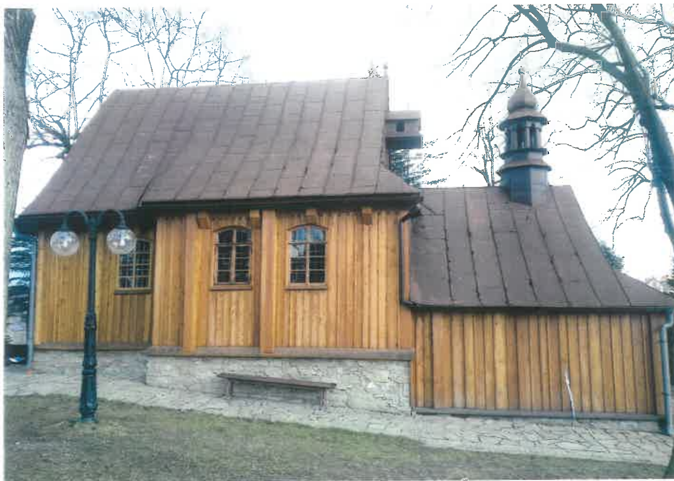
Fot. 3 Tęgorz. Kościół p.w. Narodzenia NMP na górze św. Justa – widok od strony północnej