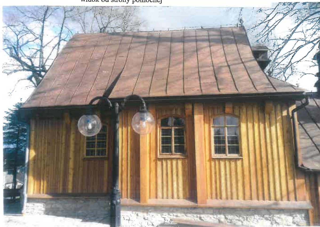
Fot. 4 Tęgorz. Kościół p.w. Narodzenia NMP na górze św. Justa – fragment kościoła od strony północnej