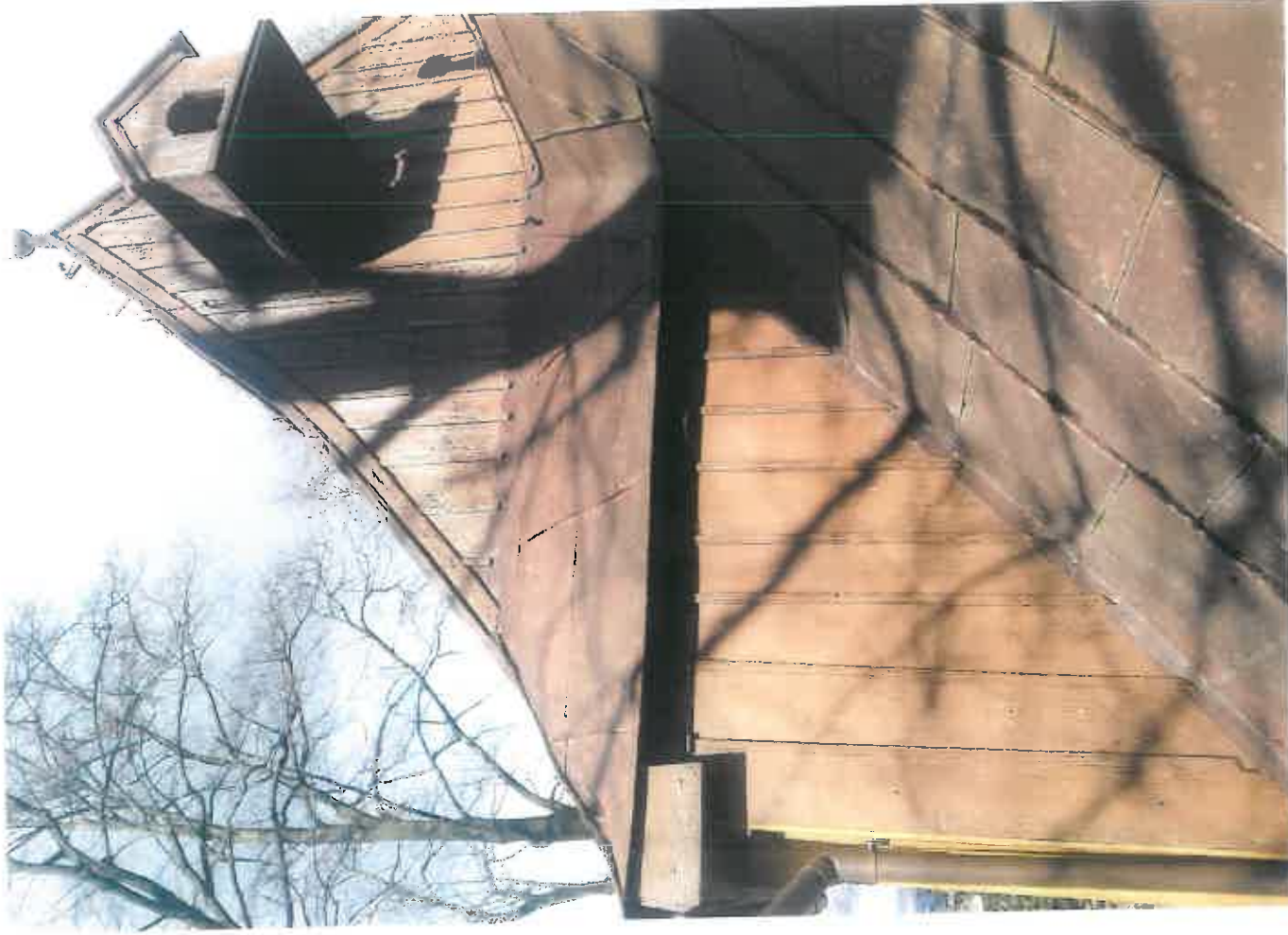
Fot. 6 Tęgoborze. Kościół p.w. Narodzenia NMP na górze św. Justa – fragment dachu z sygnaturką