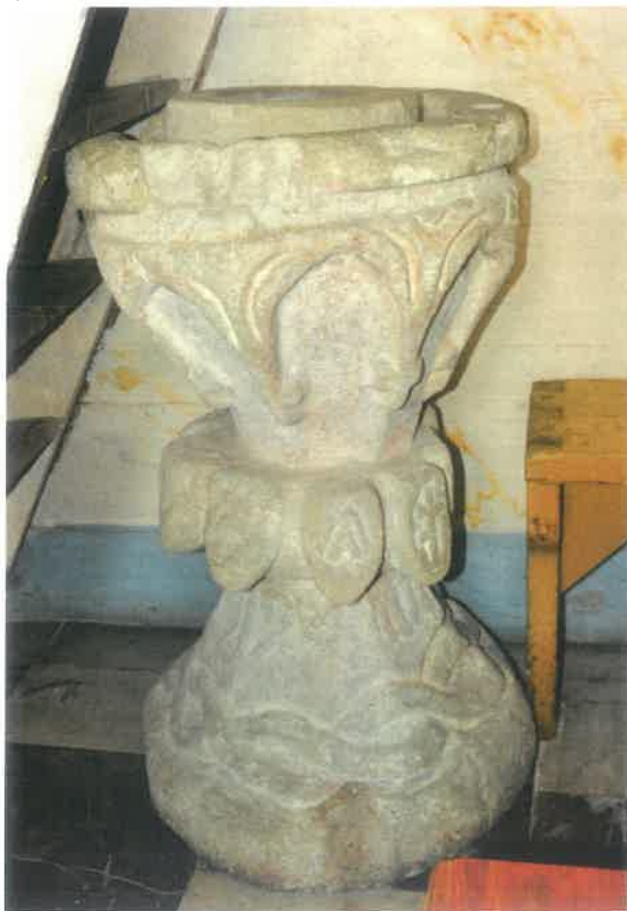
12. Późnogotycka chrzcielnica kamienna z 1534 roku.

Według Jadwigi Kuczyńskiej, spośród ośmiu herbów można rozpoznać najwyżej sześć. Mają to być herby: Orzeł Królestwa Polskiego (?), Prus (?), Niesobia, Pomian, Topór i Odrowąż 29 . Zdaniem autorki herby te należą do rodów rozsiedlonych na Sądecczyźnie, trudno jednak określić do kogo imiennie się odnoszą. Można tylko przypuszczać, że herb Pomian upamiętniać może fundację klasztoru w Juście, której mieli dokonać Chebdowie z Tropia, zaś herb Niesobia należeć mógł do Kępieńskich ( vel Kempieńskich), właścicieli sąsiednich Zbyszyc.