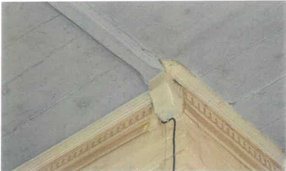
6. Ciesielska dekoracja architektoniczna górnej belki przegrody tęczowej.

Prezbiterium od nawy oddziela skromna przegroda tęczowa, typu prostokątnego, składająca się z profilowanej belki tęczowej (fot. 5) i wyposażonej w identyczny profil belki podstropowej, wspartej na dwóch prostych kroksztynach (fot. 6). Detal ciesielski przegrody,