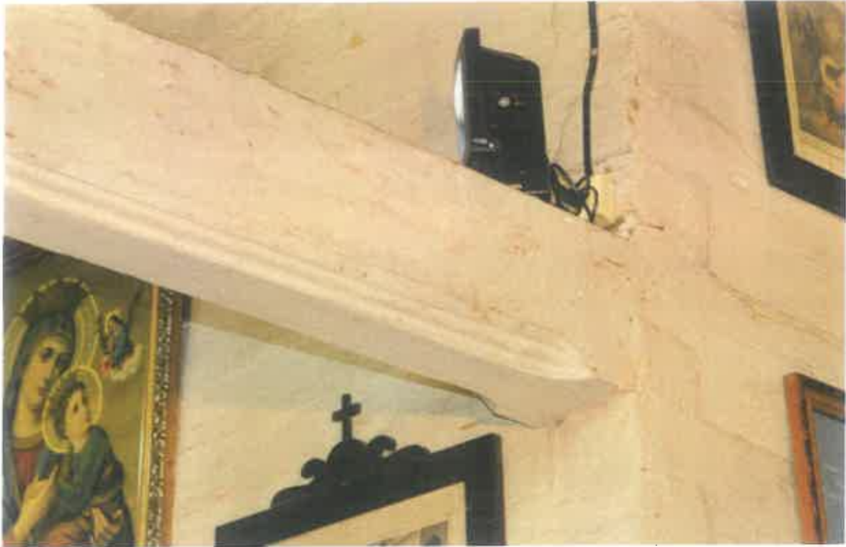
5. Ciesielska dekoracja architektoniczna belki tęczowej.