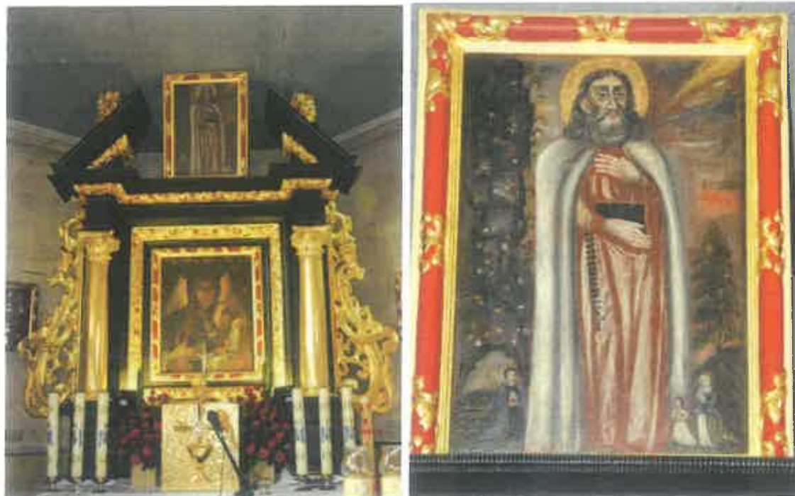
9. Nastawa ołtarza głównego. Fot. P. Łopatkiewicz 10. Obraz św. Justa. Fot. P. Łopatkiewicz

W zwieńczeniu nastawy, między elementami przerwanego przyczółka zamontowano obraz św. Justa (fot. 10), ufundowany jak wiemy w 1677 roku Jana Bora przewoźnika na Dunajcu, pochodzącego z pobliskich Zbyszyc 25 .