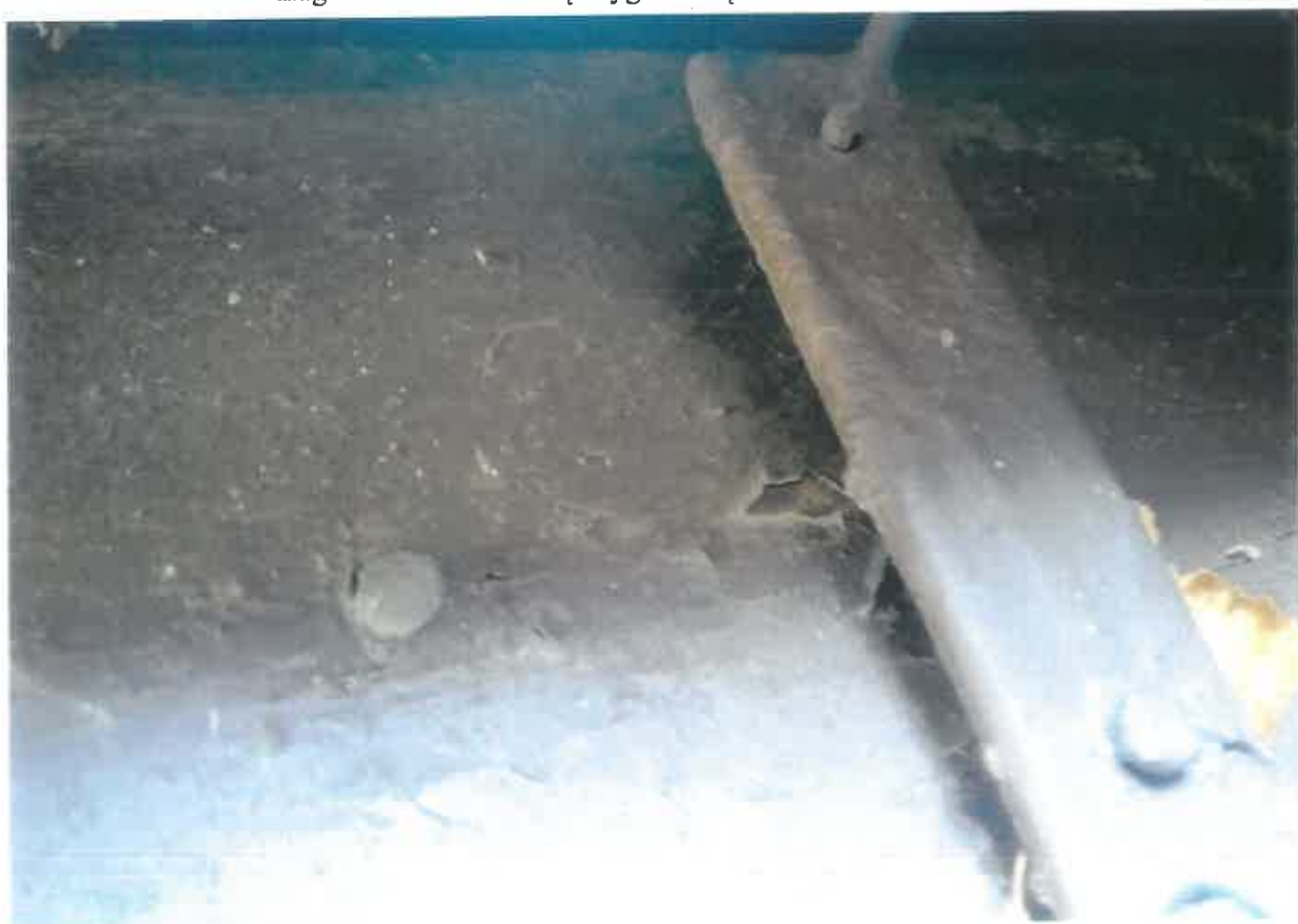
Fot. 8 Tęgoborze. Kościół p.w. Narodzenia NMP na górze św. Justa – detal