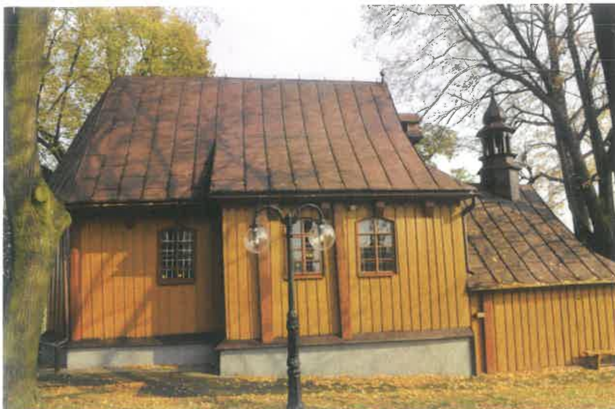
2. Kościół w Tegoborzu-Juście – widok od strony zachodniej – stan obecny.

Więźba dachowa, utrzymana w uproszczonej konstrukcji storczykowej, pochodzi bez wątplenia z czasów budowy. Do prezbiterium, od strony wschodniej, przylega niewielka zakrystia konstrukcji zrębowej, nakryta dachem pulpitowym, sięgającym poniżej okapu dachu prezbiterium, w narożniku północno-wschodnim wzmocniona kamienną, murowaną przyporą. Ściana szczytowa nawy, szalowana deskowaniem, przytwierdzona bezpośrednio do ostatniego wiązara więźby dachowej, wyposażona została w ażurową nadwieszoną galerię, kryjącą pierwotnie dzwonek sygnaturki. Kruchta południowa kryta dachem siodłowym, dwuspadowym, od frontu zakończonym trójkątnym, deskowanym szczytem, typu przyczółkowego, z szerokim okapem u podstawy. W kalenicy dachu kruchty w roku 1930 zamocowano neobarokową wieżyczkę na sygnaturkę z ażurową latarnią na kolumnkach 21 .