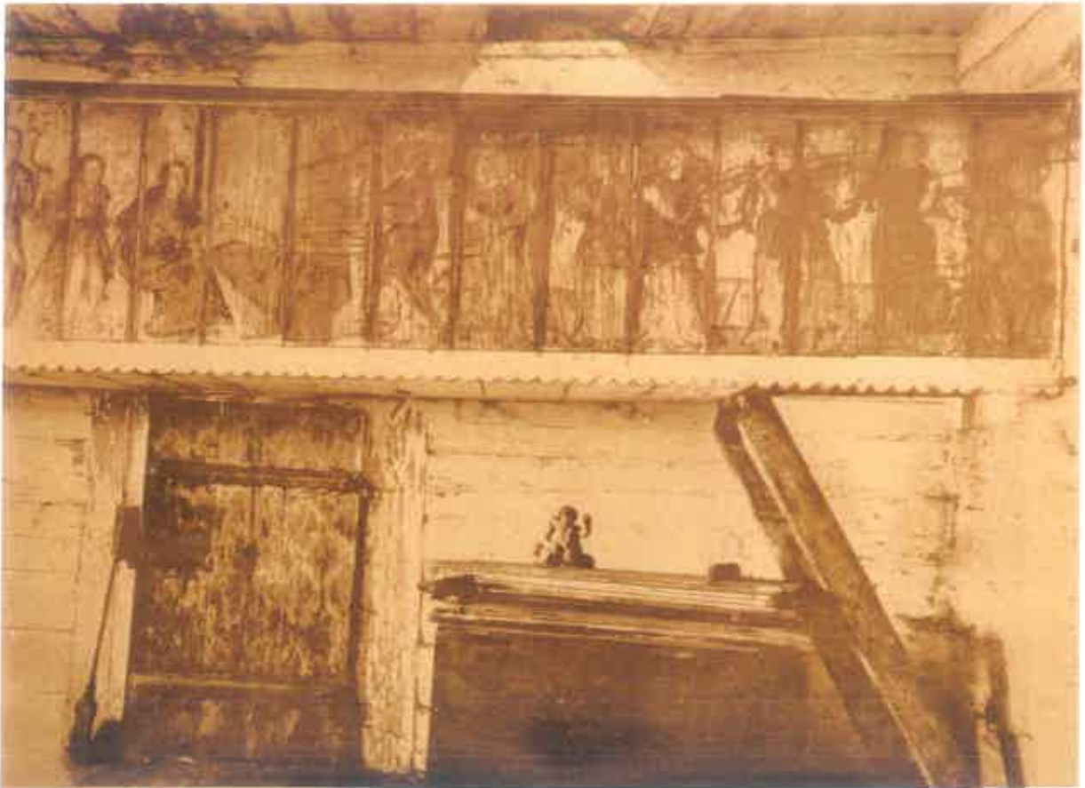
8. Wnętrze drewnianego kościoła Św. Anny w Rogach k. Krosna – z widocznym stropem belkowym zachowanym nad galerią chóru muzycznego. Fot. archiwalna ok. 1920, w zbiorach Instytutu Historii Sztuki UJ

Zabytek nasz został poddany poważnym przekształceniom kilkakrotnie. Po raz pierwszy w roku 1871. Wówczas prócz dobudowania obszernej kruchty od strony południowej, na znacznym obwodzie ścian świątyni (przypuszczalnie ze względu na zły stan zachowania budulca), wycięto podwalinę i pierwsze trzy belki zrębu. W ich miejsce, być może na nowym fundamencie, wykonano wysoką kamienną podmurówkę, sięgającą ok. 100-120 cm powyżej poziomu terenu (fot. 1). Zabieg ten dotknął ściany zachodniej nawy i prezbiterium, ścian apsydy prezbiterium i północnej ściany zakrystii, aż do jej narożnej przypory. W toku prac ściany nawy i prezbiterium zostały wówczas wzmocnione drewnianymi lisicami, spiętymi kowalskimi śrubami. W roku 1871 (o ile nie wcześniej), wykonano również obecną podsiębitkę stropu. Przypuszczalnie w latach 90-tych XIX wieku, lub nieco później, zniszczone pokrycie gontowe dachu wymienione zostało na nowy gont.