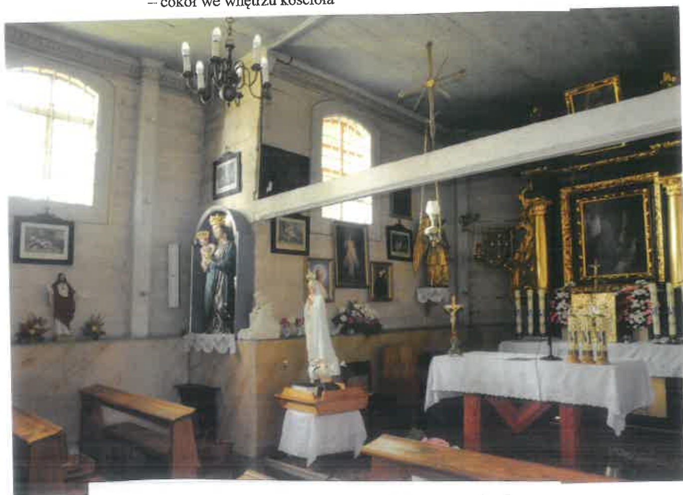
Fot. 41 Tęgoborze. Kościół p.w. Narodzenia NMP na górze św. Justa – cokół we wnętrzu kościoła