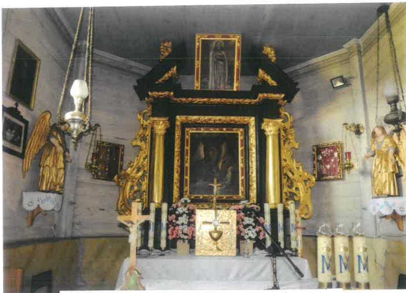
Fot. 40 Tęgoborze. Kościół p.w. Narodzenia NMP na górze św. Justa – cokół we wnętrzu kościoła