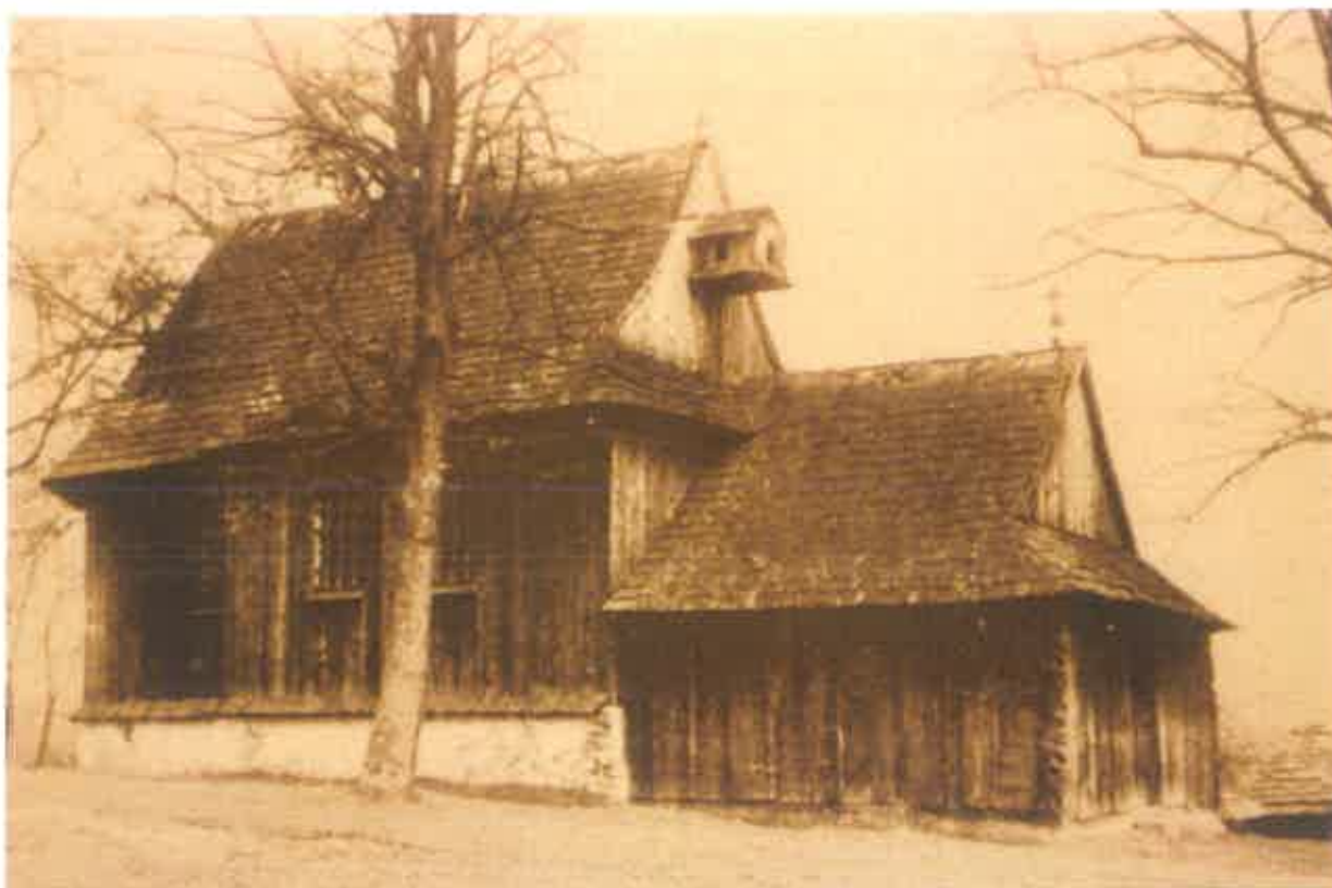
1. Kościół w Tęgoborzu-Juście – widok od strony zachodniej. Fot. archiwalna ok. roku 1890 (wg Kornecki, Kościół drewniane w Małopolsce... , s. 141).

modrzewiowy, na znacznej wysokości w pobliżu Dunajca. Ołtarzyk ładny zdobi wnętrze 19 . Nieco więcej uwagi krakowski uczone poświęcił zachowanej wówczas na zewnątrz kropielnicy kamiennej, którą słusznie zidentyfikował jako chrzcielnicę pochodzącą z dawnego kościoła parafialnego w Tęgoborzu: Kropielnica zewnątrz kościoła przy wejściu, jest starą chrzcielnicą przeniesioną tu z Tęgoborzy, gdzie ją oglądał Łepkowski w r. 1851. Jest z piaskowca, ma kształt kielicha, podobna do łąckiej, tylko roboty grubszej, jakby chłopskiej. Na nodusie wyrzeźbiono 8 tarcz z herbami (w dalszej części noty znajdują się przerzysy i identyfikacje poszczególnych herbów) 20 .