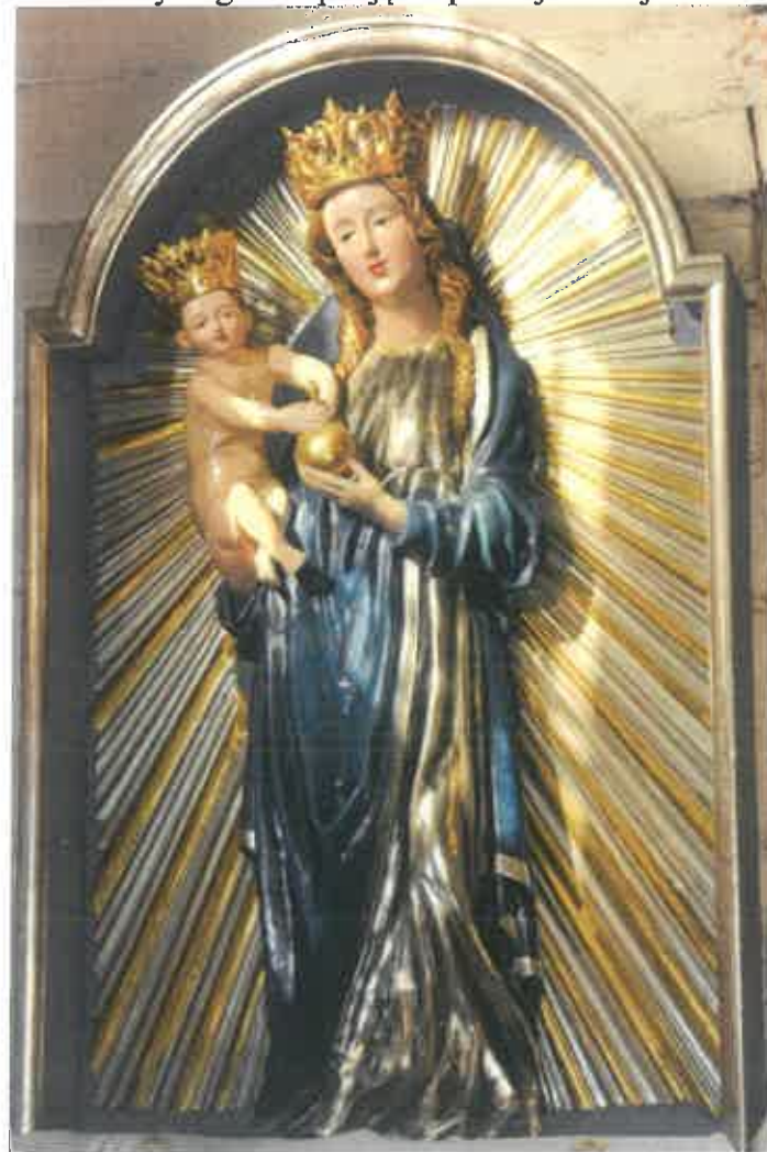
11. Gotycka rzeźba Matki Boskiej z Dzieciątkiem ok. 1470. Fot. P. Łopatkiewicz

stulecia (fot. 11), którą pośrednio łączyć można z działalnością otoczenia warsztatu Mistrza ołtarza Trójcy Świętej z katedry na Wawelu 27 . Figura wys. ok. 120 cm, w części polichromowana, w części zaś srebrzana, poddawana była kilkakrotnym pracom konserwatorskim, w wyniku których pierwotny kształt artystyczny dzieła został niestety istotnie zmieniony. Obecnie wymaga ona podjęcia profesjonalnej konserwacji.