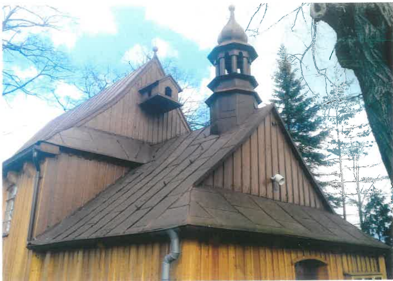
Fot. 7 Tęgoborze. Kościół p.w. Narodzenia NMP na górze św. Justa – fragment dachu z wieżą i sygnaturką