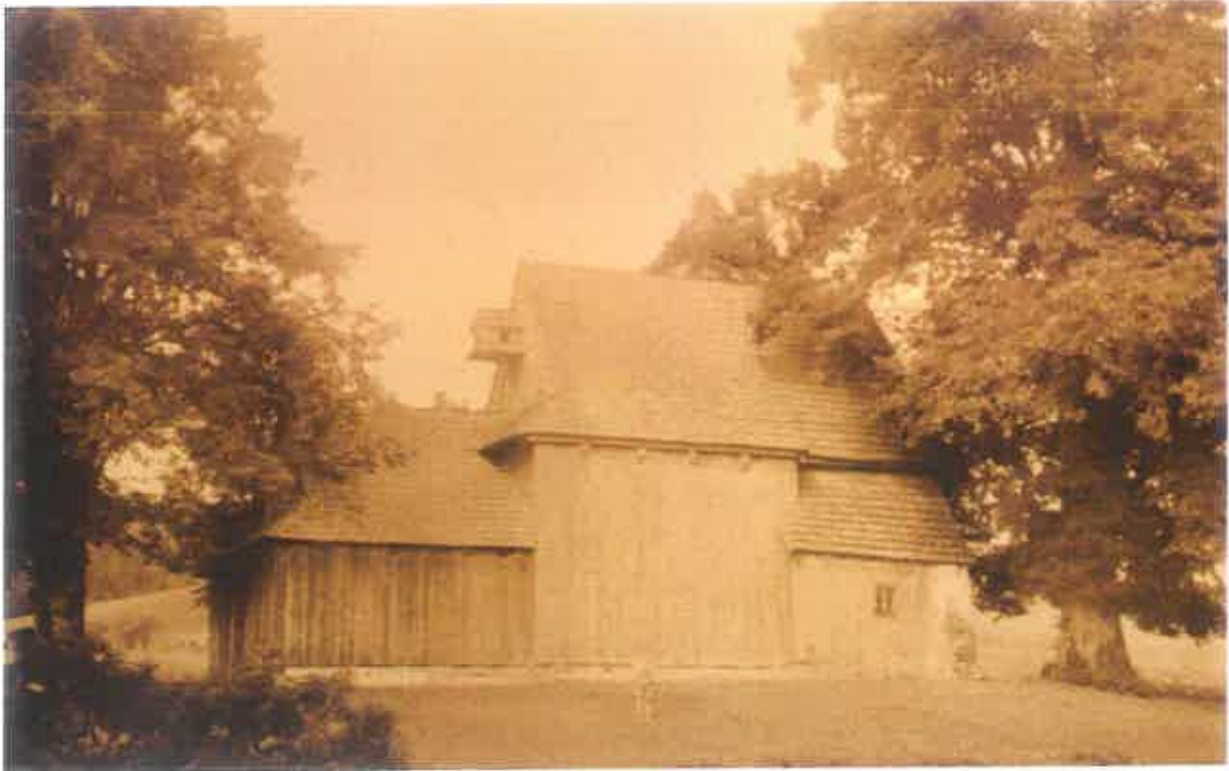
3. Kościół w Tegoborzu-Juście – widok od strony wschodniej – stan ok. 1920.