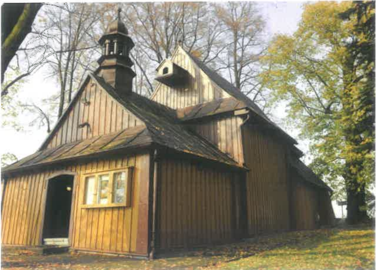
4. Kościół w Tegoborzu-Juście – widok od strony południowo-wschodniej – stan obecny.